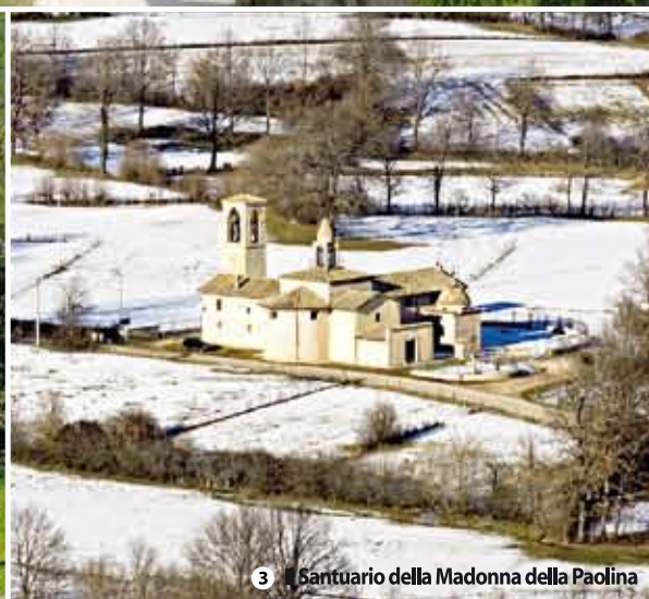
3 Santuario della Madonna della Paolina