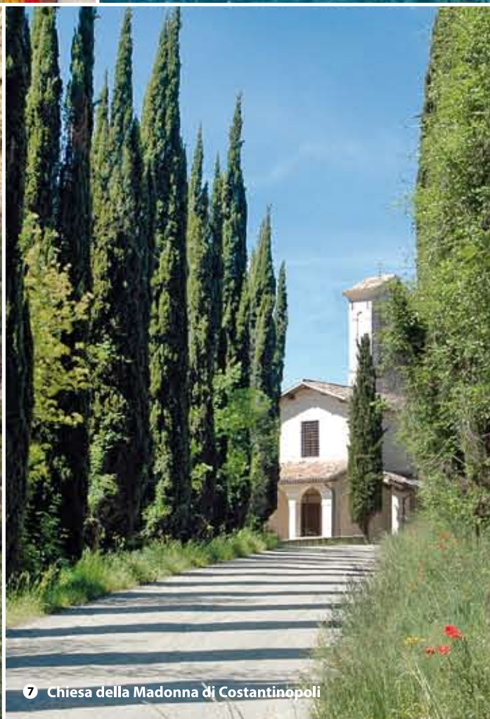
7 Chiesa della Madonna di Costantinopoli