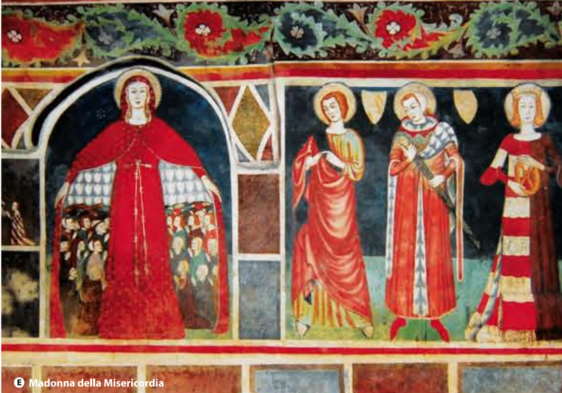
E Madonna della Misericordia

detto. Verso il 529, Benedetto si ritirò a Montecassino assieme a pochi discepoli. Sulla cima del monte, fondò un monastero dopo aver consacrato a san Martino di Tours il tempio di Giove ed Apollo. Lì Benedetto portò a termine la Regula cui, direttamente o indirettamente, si sarebbe ispirato per secoli il monachesimo occidentale, fondando la vita monastica sulla pratica dell'obbedienza e dell'umiltà. Eppure, l'umile Benedetto aveva definito la sua Regula un «abbozzo per principianti». Morì il 21 di marzo del 546 o del 547.