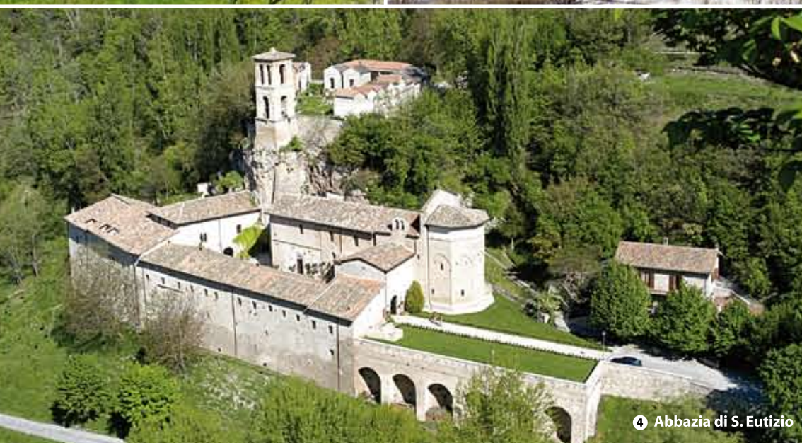
4 Abbazia di S. Eutizio