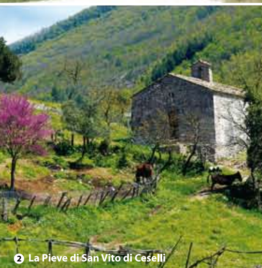
2 La Pieve di San Vito di Ceselli