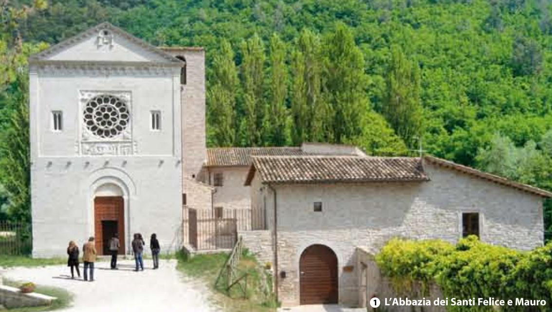
1 L'Abbazia dei Santi Felice e Mauro